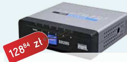
CISCO Switch 5-portowy