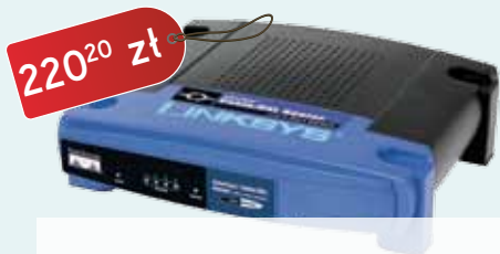
LINKSYS Router kablowski z switchem 4-portowym

Jeśli mają Państwo jakiegokolwiek pytania odnośnie tematyki poruszanej w niniejszym artykule prosimy o kontakt mailowy z działem informatycznym pod adresem internet@tesat.pl lub telefonicznie (61) 649 69 69.