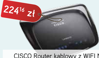
CISCO Router kablowski z WIFI N z switchem 4-portowym + karta sieciowa USB